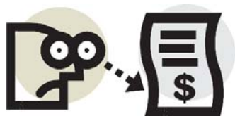
Tabela Salarial dos Docentes do Ensino Superior