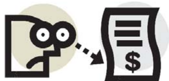
Tabela Salarial dos Docentes do Ensino Superior DEDICAÇÃO EXCLUSIVA