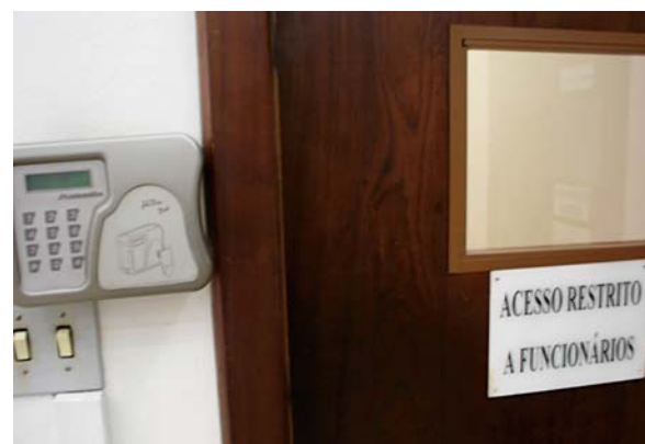
Laboratórios com travas eletrônicas

Na época em que o contrato foi assinado houve pouca ou nenhuma discussão com a comunidade acadê-